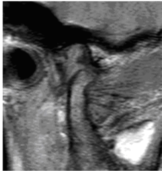
【 画像 2 】